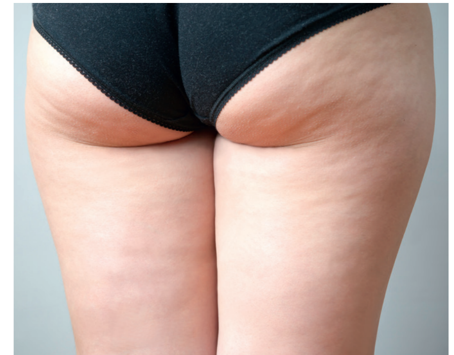
– Yngre kvinner har også sine problemer. For eksempel kommer ofte de som har en dårlig definert rumpe og vil ha vår spesialitet «J-Lo stussen». Da gjør vi en SmartLipo fettfjerning på overgangen mellom rumpe og lår, forteller Dr. Grova.