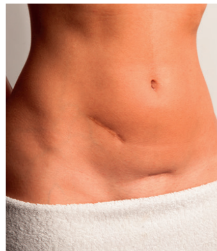
Mange kvinner som har tatt keisersnitt har fått en skjæmmende «pølse» over dette. Litt SmartLipo fett-fjerning her og problemet er løst!